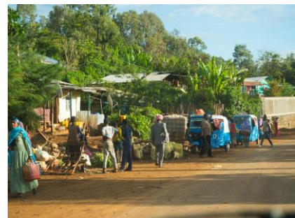
Natur und Menschen in Äthiopien.